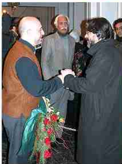
Maestro Hossein Alizadeh