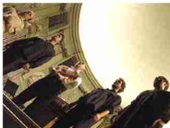
Toulouse / Eglise Saint Jérôme