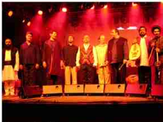
Rennes au liberté