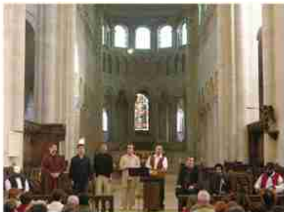
Olivet / Eglise de St. Benoit

Concert en tournée en France - Oct. & Nov. 2005