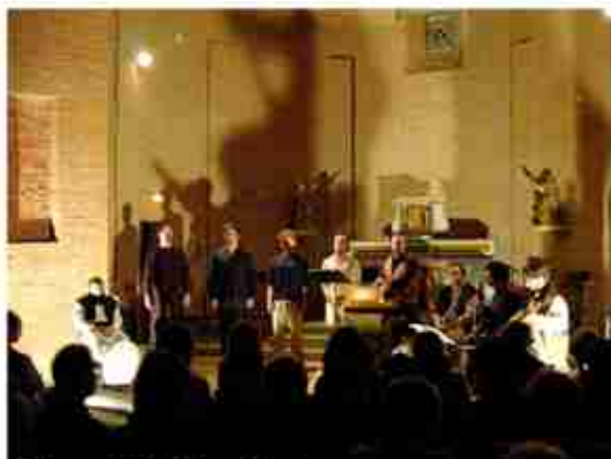
Toulouse / Saint Pierre-Quint