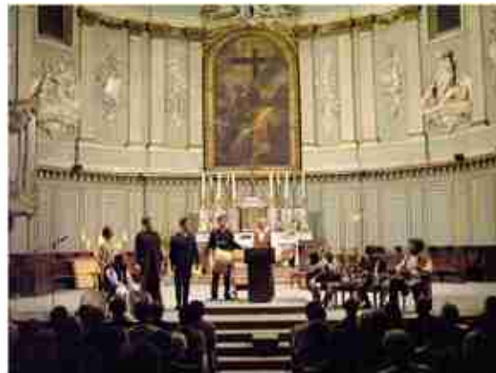
Toulouse / Eglise Saint Jérôme