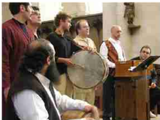
Olivet / Eglise de St. Benoit