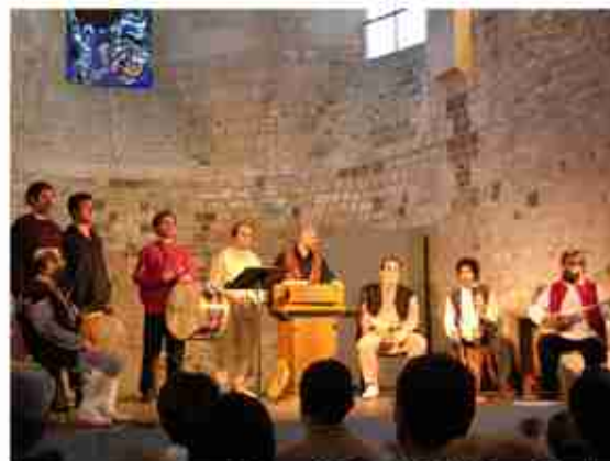
Orléans / Eglise de Saint Pierre Puellier