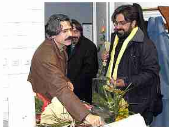
Maestro Keyhan Kalhor